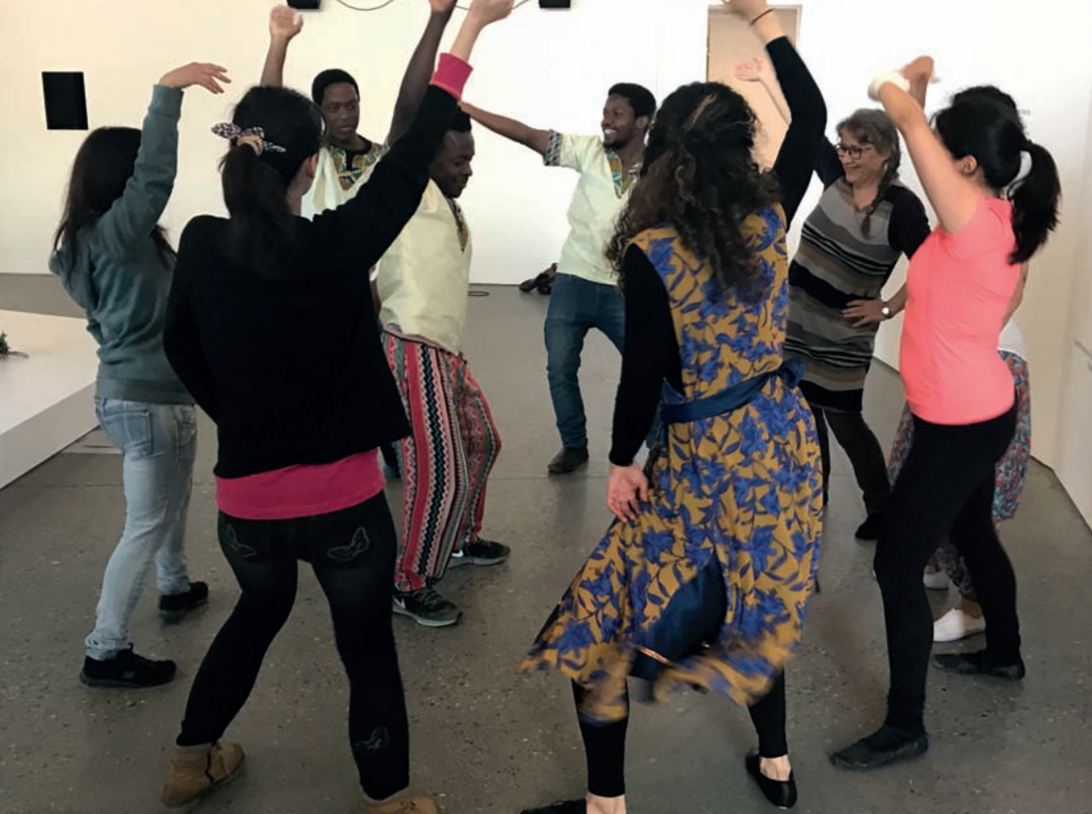
Trondheim kunstmuseum- dansende omvisning i utstillinga «Deltakelse». NTNU-studenter fra Uganda, Iran, Colombia, Guatemala og Sør-Afrika 30. april 2017.

potensielle nye utøvere av en kroppslig tradisjon og ikke er i tråd med retningslinjene til UNESCO konvensjonen fra 2003 om vern og videreføring av immateriell kulturarv.