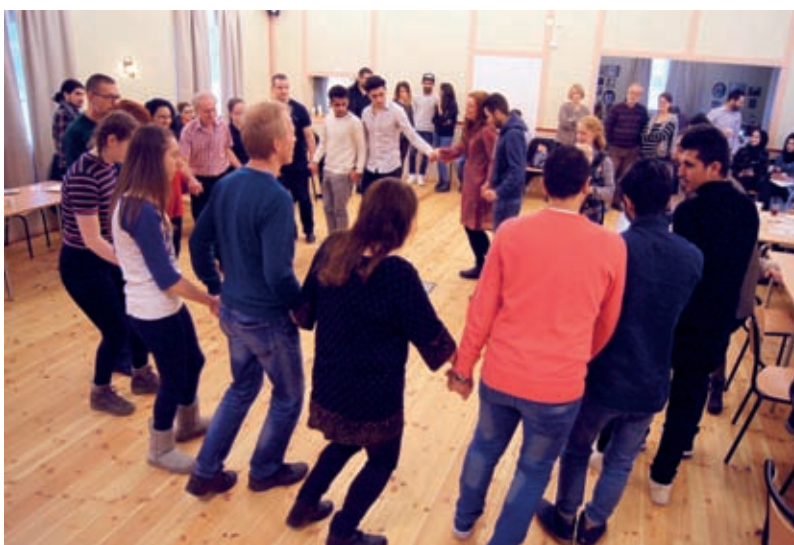
Utstilling 2. Norsk-syrisk dansefest 28. januar 2017.

Tittel «Evaluating new interactive methods for dissemination of dance in museums»