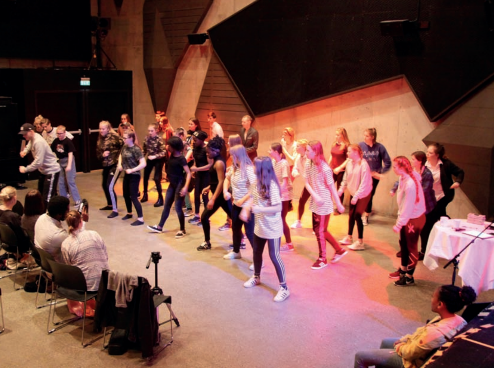
Utstilling 3. Dansekonskurranse Dansens dag 30. april 2018.

arkiv og museer har avdekket et behov for ny kompetanse på formidlingsmetoder for ivaretagelse og dokumentasjonsteknikker hvor UNESCO-konvensjonen er forutsetningen.