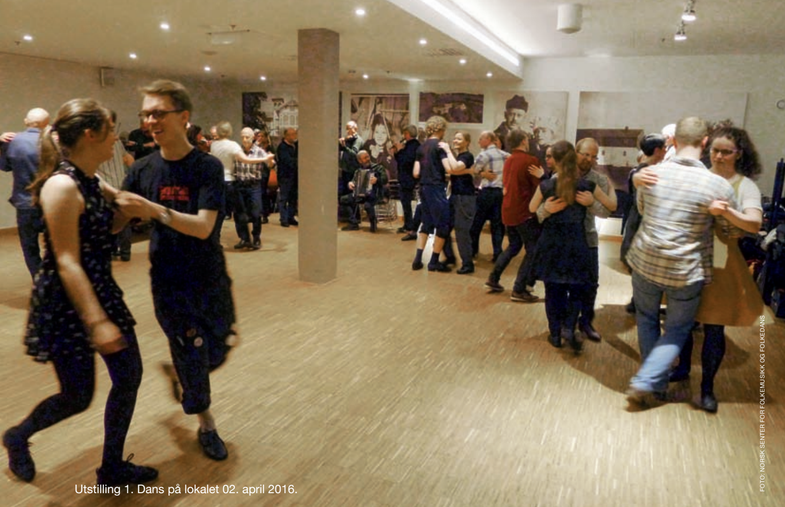
Utstilling 1. Dans på lokalet 02. april 2016.