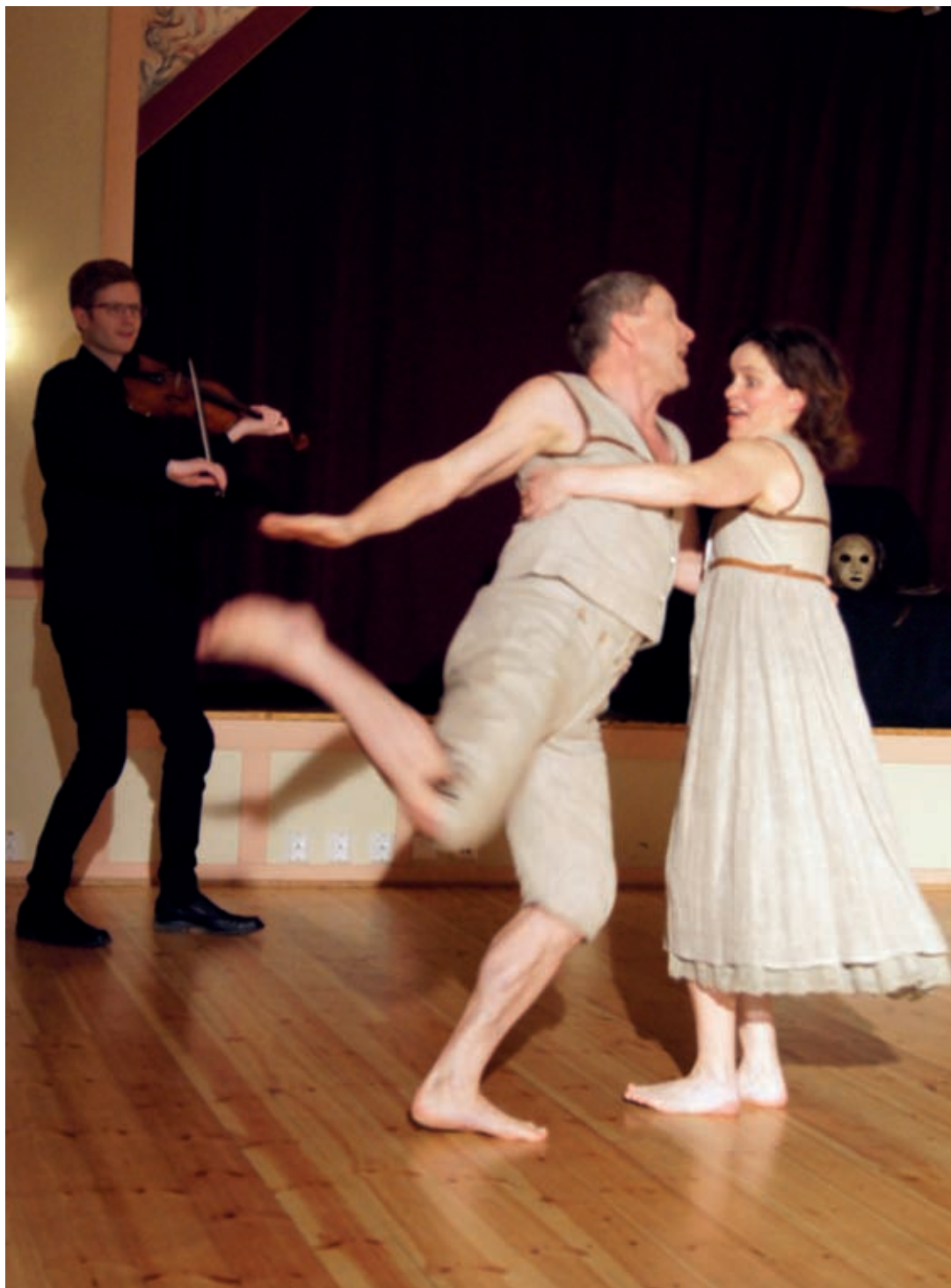
Utstilling 2. Danseforestillingen MØTE og dansefest med spelemannslag. 18. februar 2017.

mange danseklubber rundt om i landet fått vite om utstillingene. Internasjonale nettverk har fått kjennskap til prosjektet gjennom publikasjoner og konferanseinnlegg. Publikum fra hele Norge har deltatt i utformingene av utstillingene i stor grad, gjennom innsending av tekst, foto og film, samt deltagelse på arrangementene. Etter dette treårige utviklingsprosjektet er utstillin-