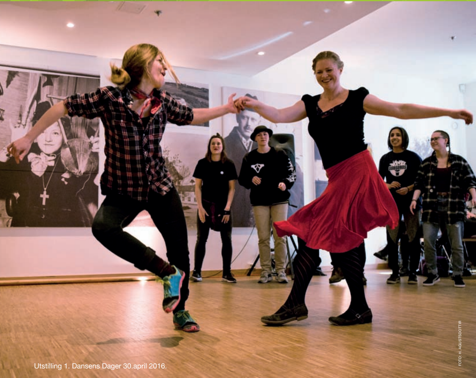
Utstilling 1. Dansens Dager 30.april 2016.