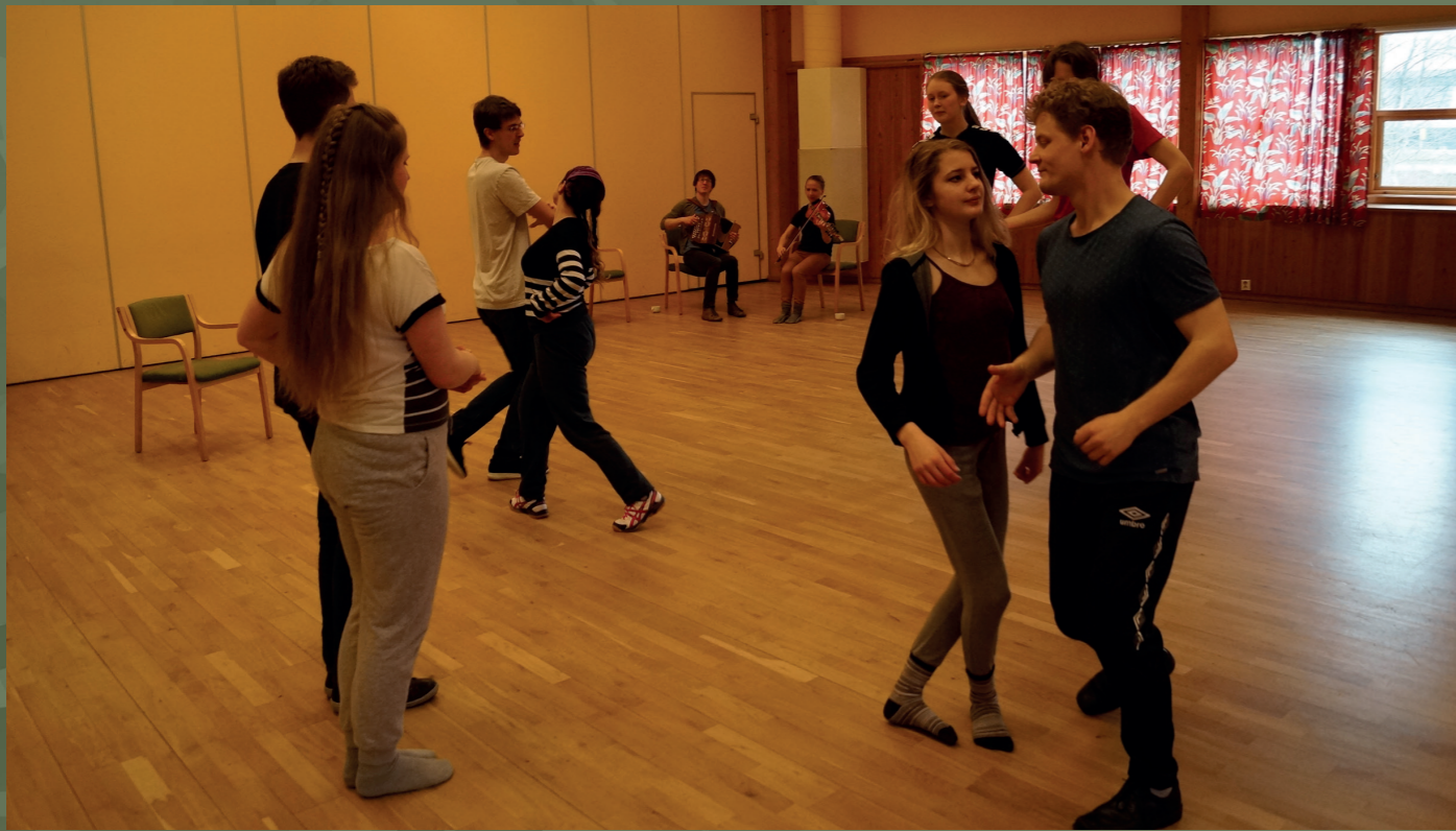
Helgesamling på Siddis-stova i Stavanger