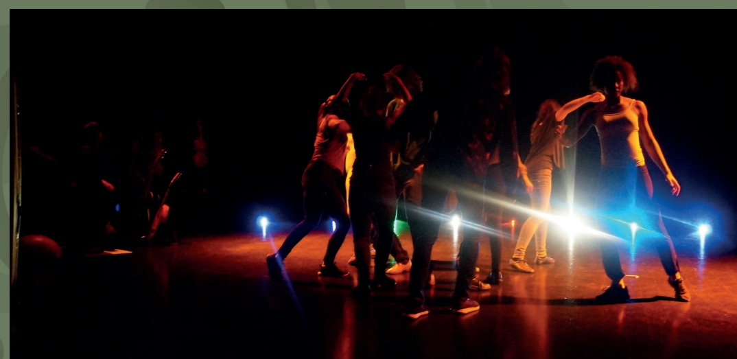
«Sviver i det», sluttforestilling til «Rogalender»