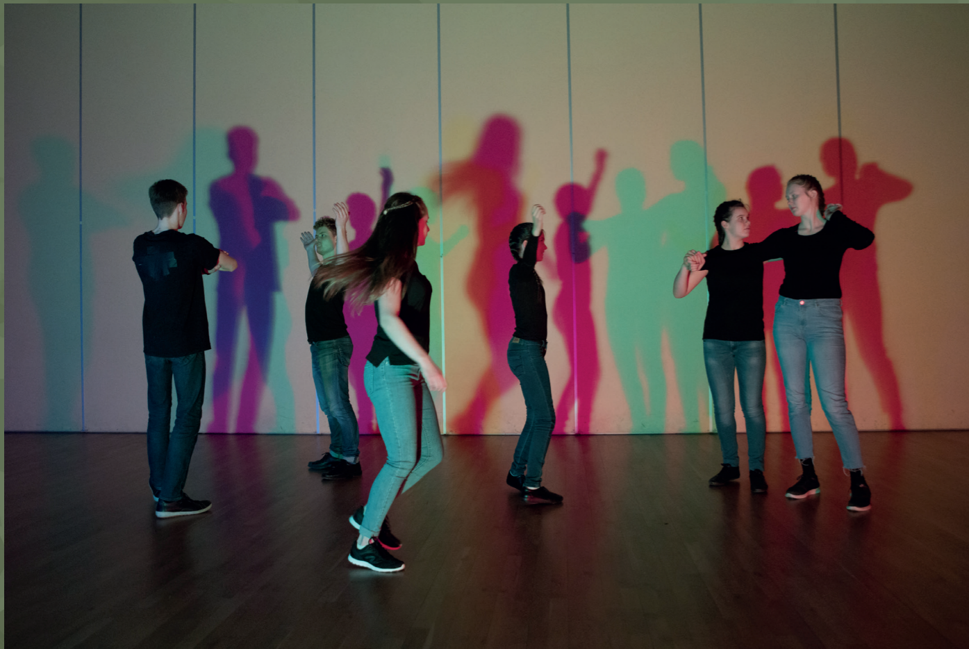
Til venstre: "Dansehuset"