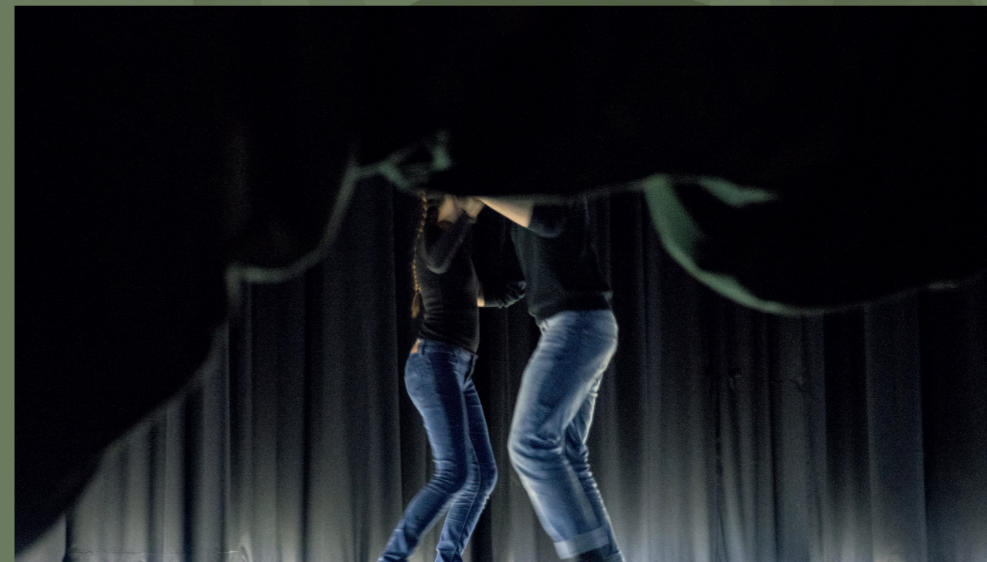
Sluttrapport Bygda dansar Rogaland