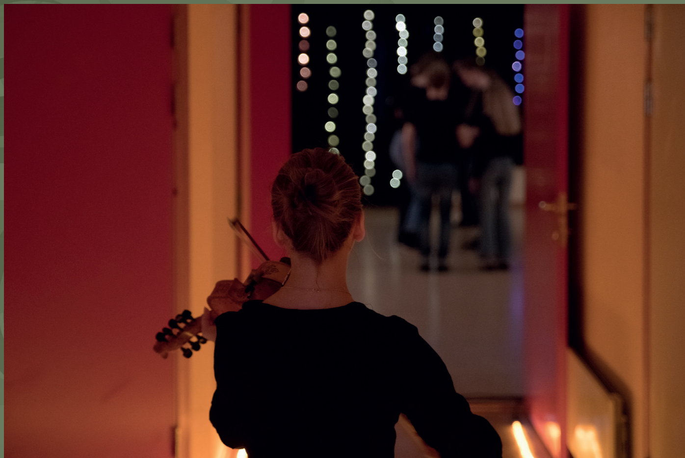
Sluttrapport Bygda dansar Rogaland