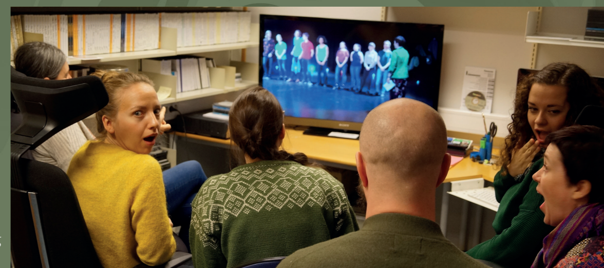
Arkivtitting sluttforestilling