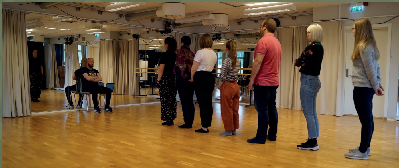
Over: fra fagdager i Trondheim Under: fra en av skoleturnene