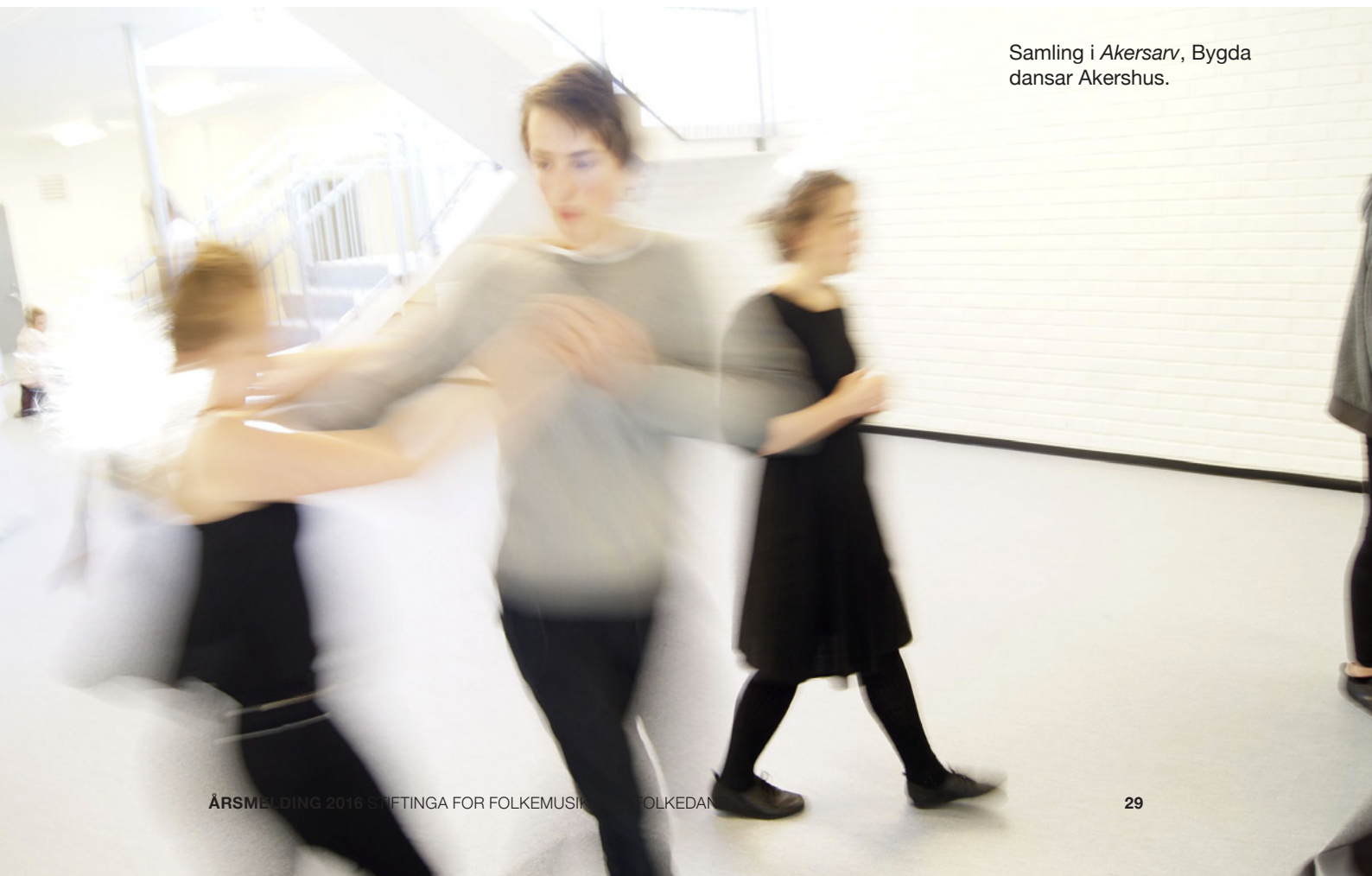
Samling i Akersarv, Bygda dansar Akershus.