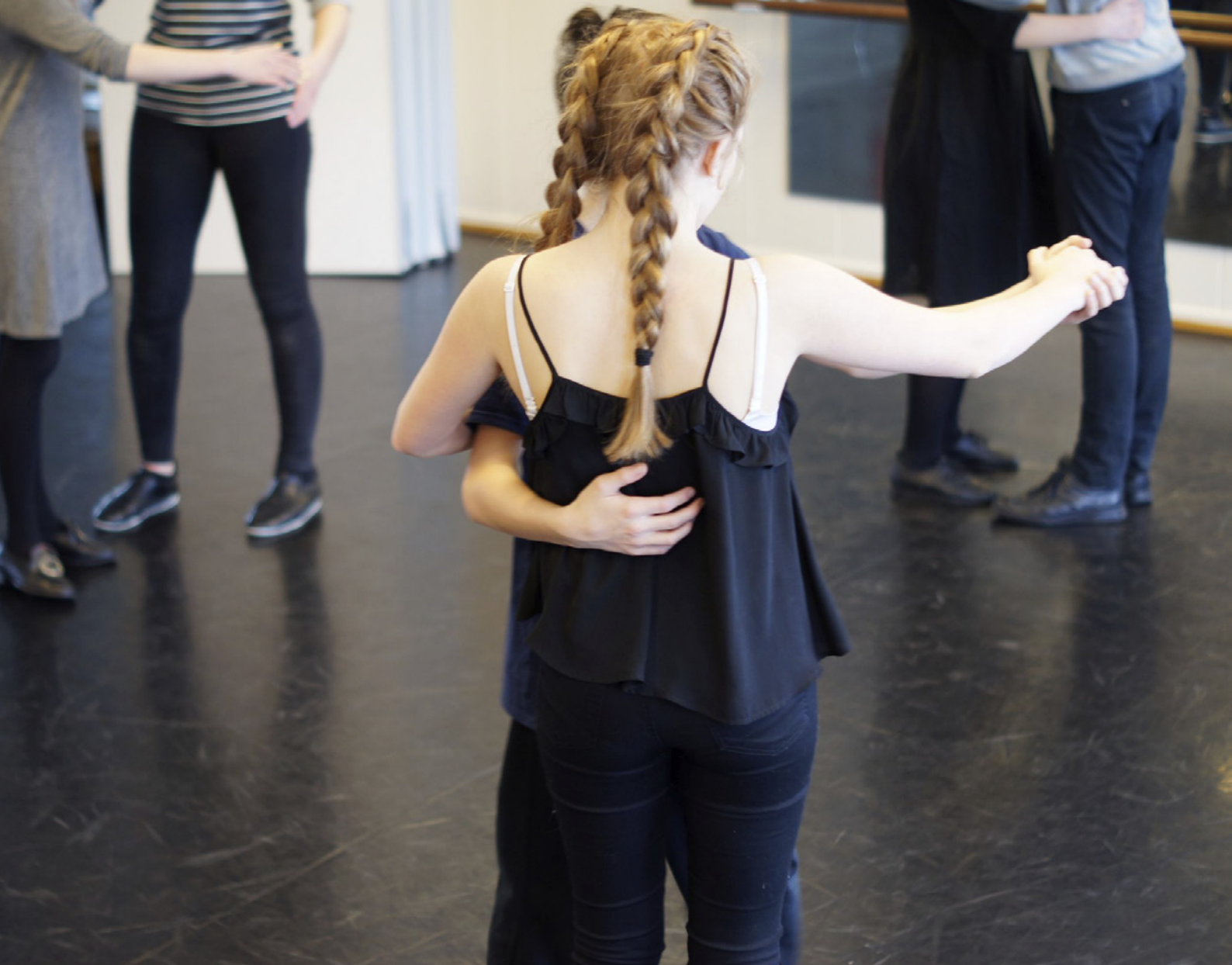
Samling i Akersarv, Bygda dansar Akershus.

utdanne folkedansere, som igjen veileder/instruerer mange. Det historisk lange og gode samarbeidet med Dansevitenskap ved NTNU ble utfordret av Studietilsynsforskriften og stoppet flere EVU-emner i 2016.