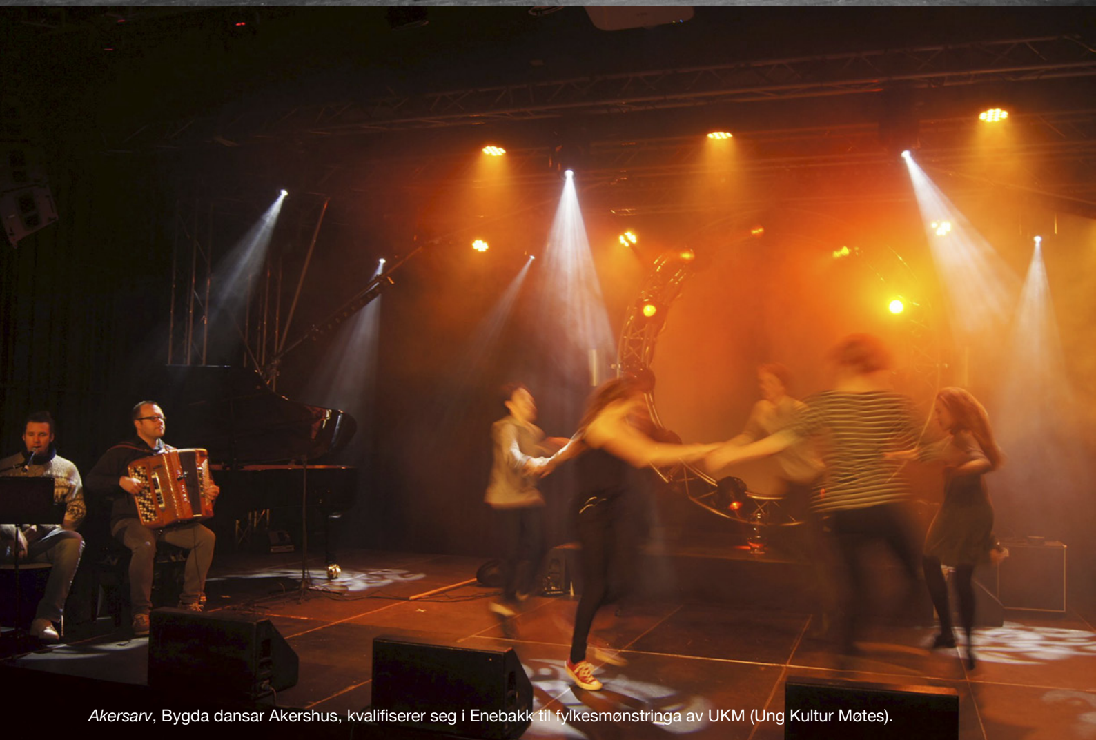
Akersarv, Bygda dansar Akershus, kvalifiserer seg i Enebakk til fylkesmønstringa av UKM (Ung Kultur Motes).