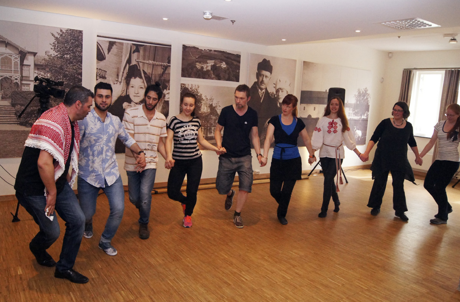
Drop in undervisning i syrisk dabke, arrangement under museumsutstillingen Dans i Norge .

Rådet hadde 5 ordinære møter. De behandlet 48 saker. Møtereferatene ble publisert på nettsidene. Norsk senter for folkemusikk og folkedans var sekretariat.