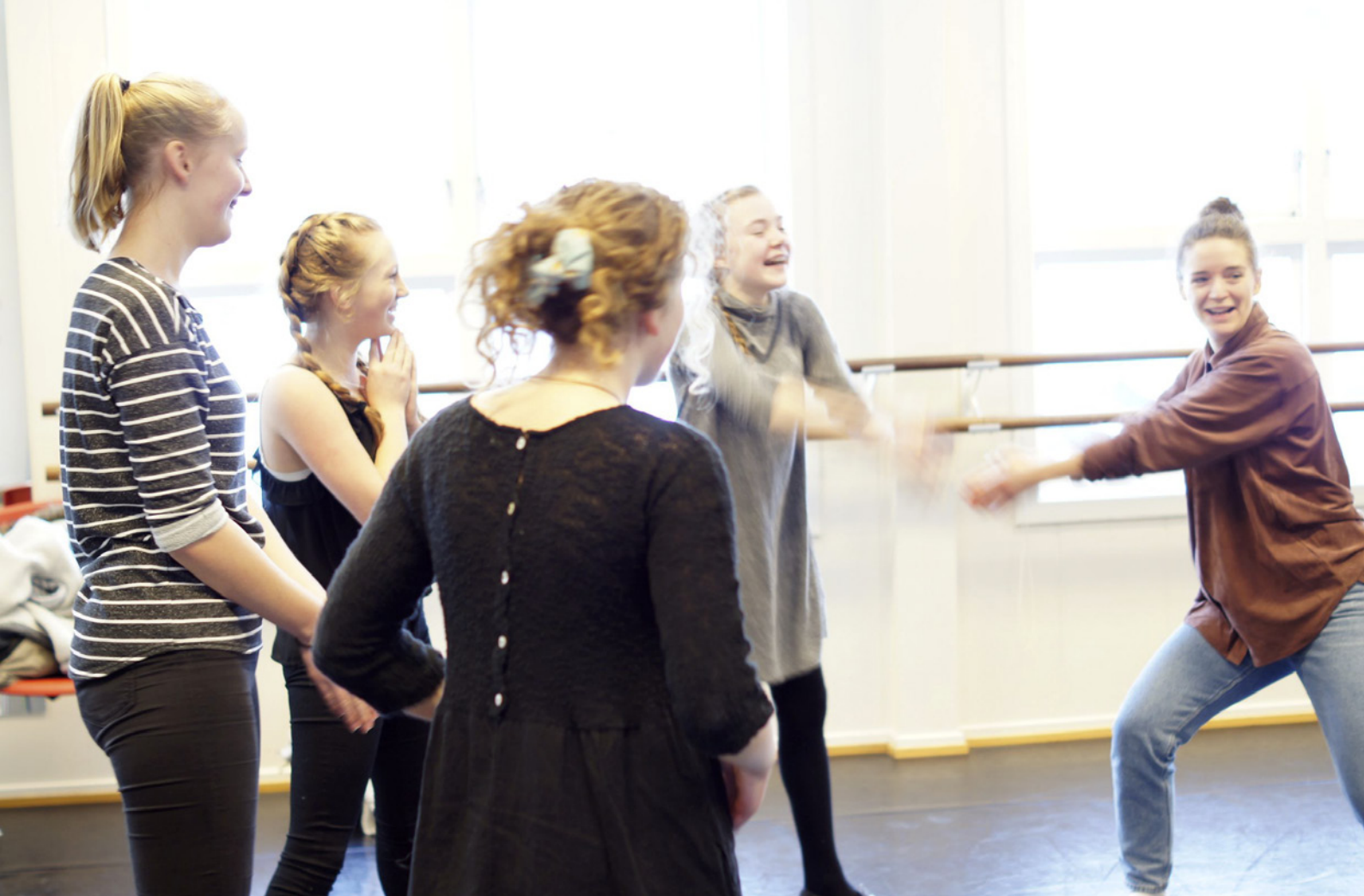
Samling i Akersarv, Bygda dansar Akershus.

Prosjektet Interaktiv danseformidling , viste museumsutstillingen Dans i Norge , 15. mars til 31. mai. Publikum i utstillingen ble ikke registrert da utstillingen inngikk i generell inngang på Ringve Musikkmuseum, men besøkstallene lå over gjennomsnittet for en så kort utstillingsperiode (2,5 måneder) i lavesongen. Publikumstallet ble økt gjennom 5 arrangementer / dansetrinn som hadde til sammen 720 besøkende: