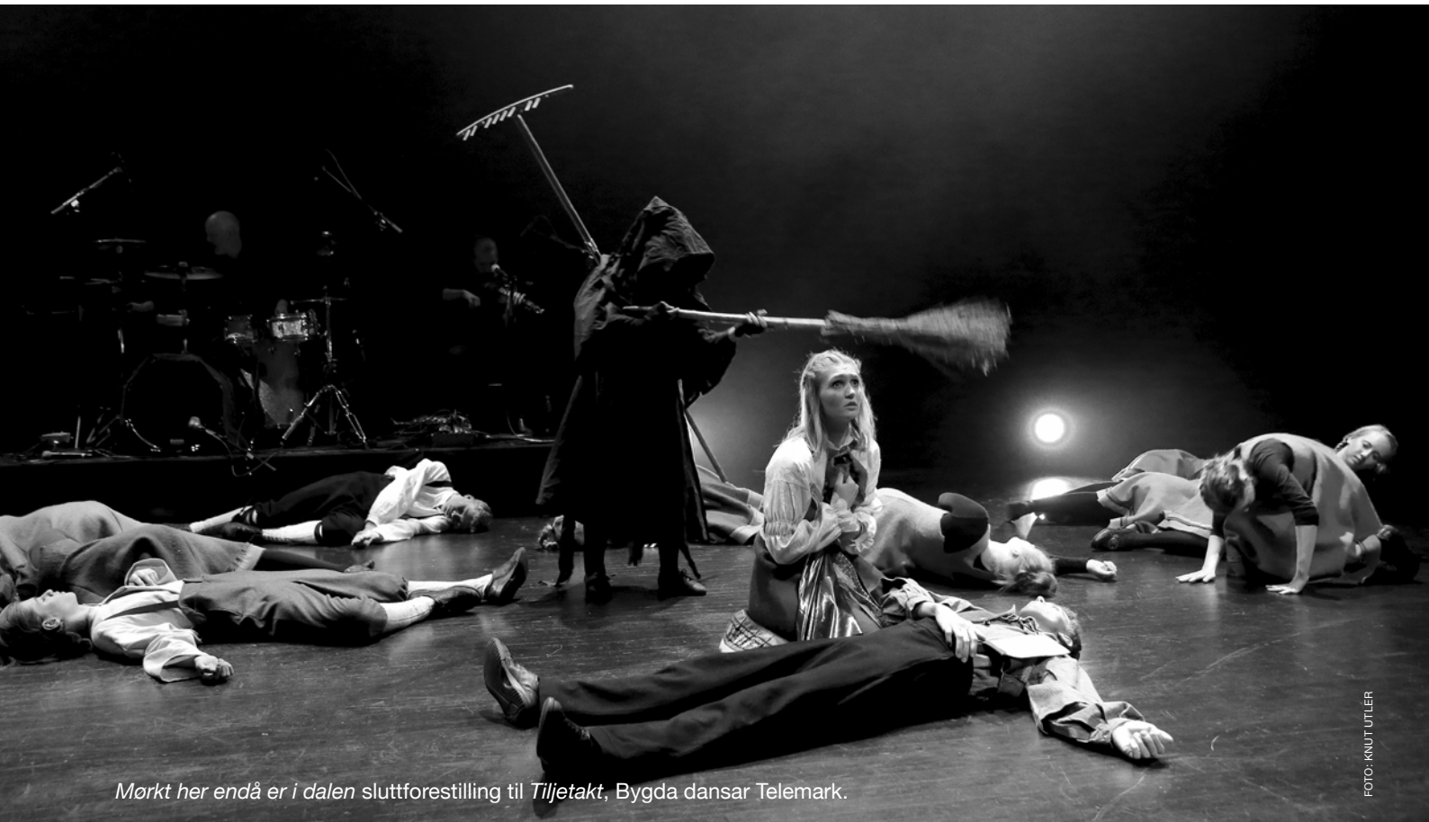
Mørkt her endå er i dalen sluttforestilling til Tiljetakt , Bygda dansar Telemark.