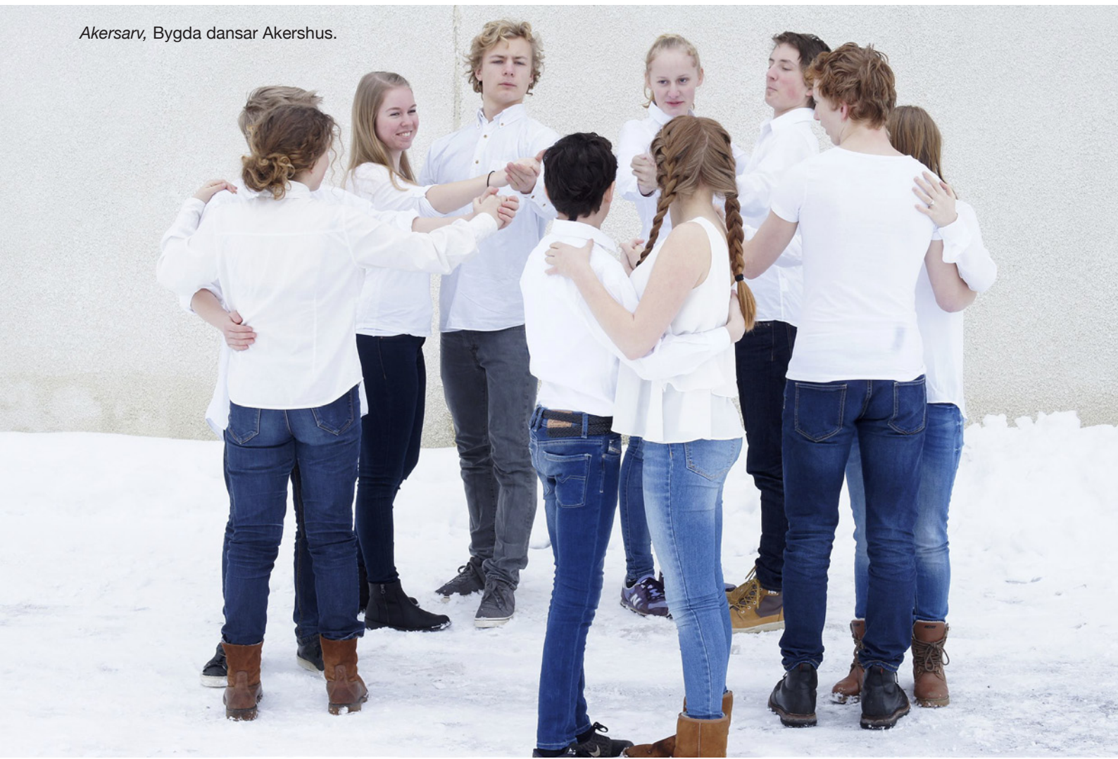
Akersarv, Bygda dansar Akershus.