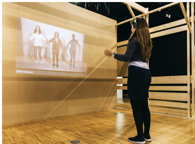
Museumsutstillingen Dans i Norge : Drop in undervisning i somalisk dhaanto dans og instruksjons- installasjon i swing, vals, dhaanto, house og bollywood.