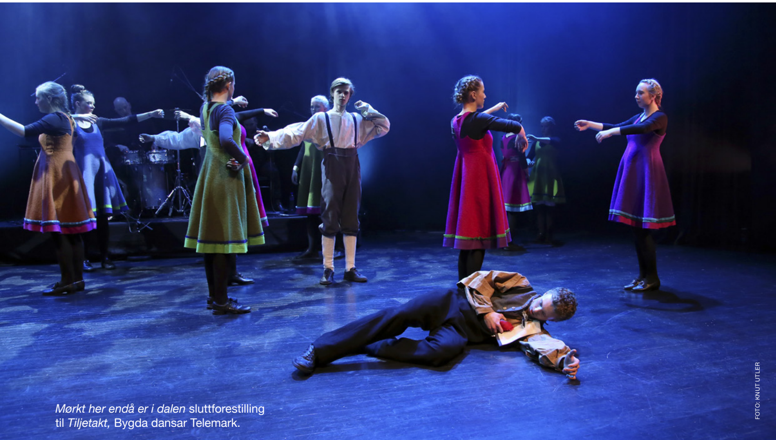
Mørkt her endå er i dalen sluttforestilling til Tiljetakt , Bygda dansar Telemark.