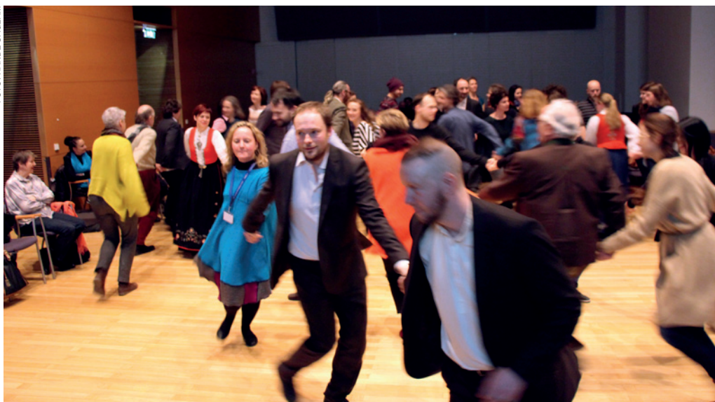
Music for Dance, European Voices 5, Norsk aften, Wien.