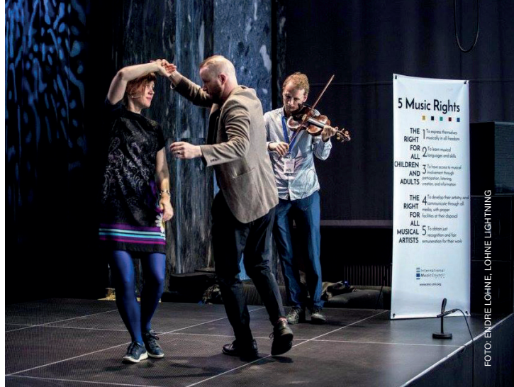
Europeisk musikkongress, 8th European Forum on Music, Oslo.

ansatte og samarbeidspartnere. Prosjektet gjennomføres fylkesvis der lokalmiljøet søker Sff om å få prosjektet til fylket, og det kreves en delfinansiering fra fylkeskommunen. Stiftinga har det faglige, pedagogiske, kunstneriske og administrative ansvaret for prosjektene. Prosjektet samarbeider med lokale ressurspersoner og lag. Hvert delprosjekt går over tre år med prosjektansatte og inkluderer en kontinuerlig utvikling av metodikk for å lære bort tradisjonsdans og utvikle sceniske produksjoner basert på tradisjonsdansens og -musikkens premisser.