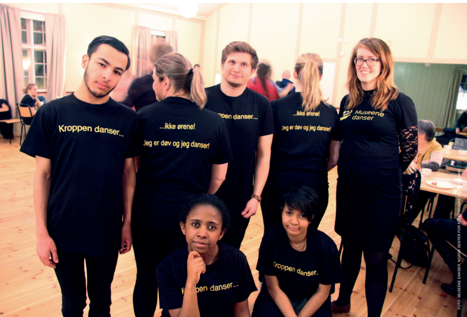
Dans for døve og hørende, dansefest februar 2018, Skogheim Sverresborg Trøndelag Folkemuseum.

Livets dans – dans i kvardag og fest! En promoversjon av vandreutstillingen Museene danser Norge ble vist som festivalutstilling på Førdefestivalen i juli. Innhold ble satt sammen av utstillingen Dans i Norge og Livets dans , i tillegg til lokalt arkivmateriale fra Sogn og Fjordane. Fem visningsdager i ungdomshuset VIKING i Førde sentrum, 5.-8. juli.