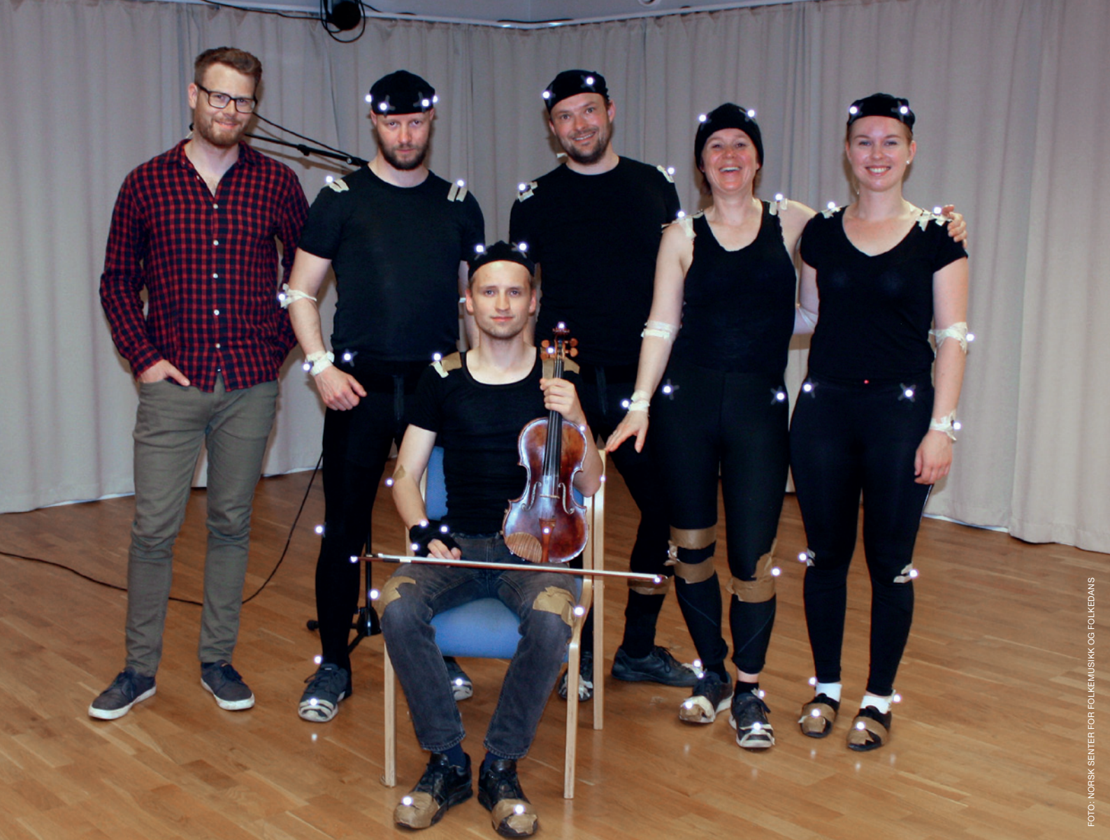
Dancing a Tune – forskningskonsert, forskere og utøvere.