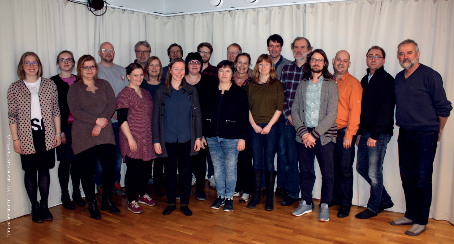
Seminar for Nettverk for norske folkemusikkarkiv.