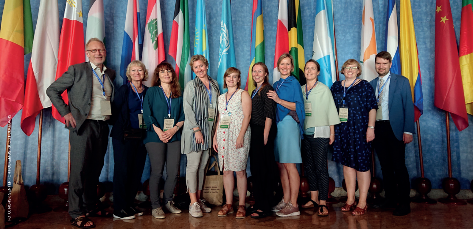
UNESCO Thirteenth Session of the Intergovernmental Committee for the Safeguarding of the Intangible Cultural Heritage (13.COM), 4.–8. desember, Mauritius.