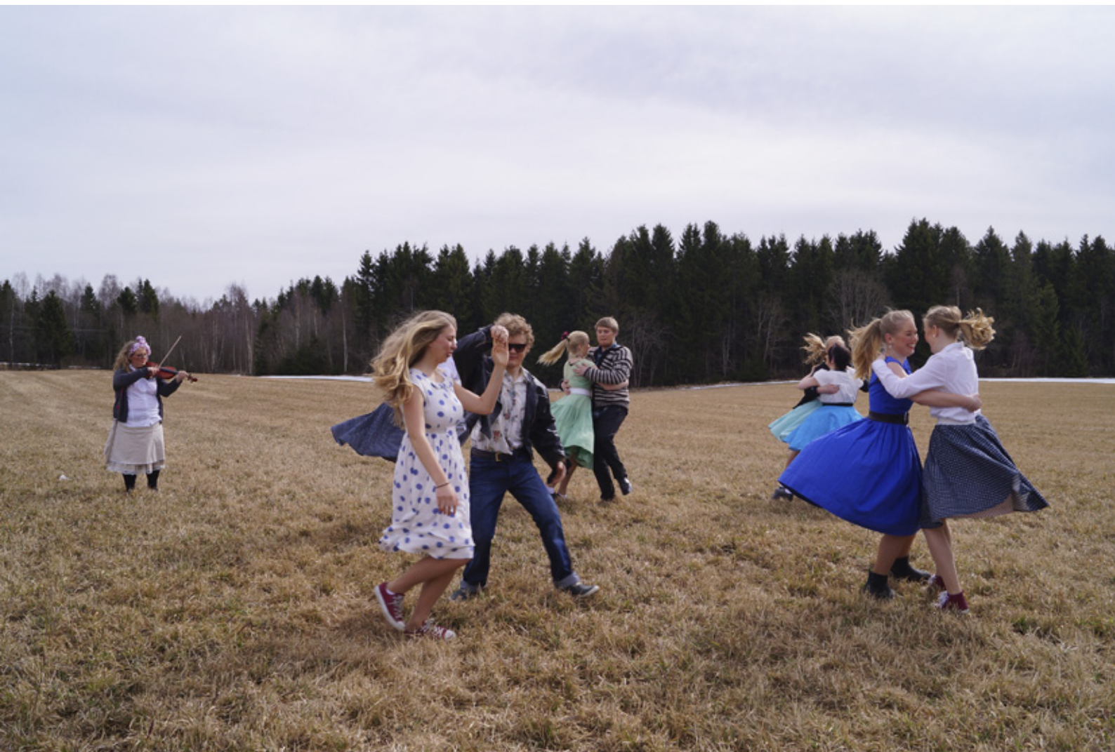
Pressebilde til midtforestillinga «Nå har det hendt!»

for å gi ungdommen større perspektiv på, og kunnskap om egen dans. Målsettingen er både å utvikle et lokalt ensemble som kan føre videre folkedansen i fylket, men også å stimulere talenter til å arbeide videre med dansen sin. Det produseres to danseforestillinger i prosjektet med scenisk bruk av de lokale folkedansene. Den siste av forestillingene, som avslutter det treårige prosjektet, knytter til seg en profesjonell koreograf og regissør på nordisk nivå, og blir vist på scener lokalt og nasjonalt.