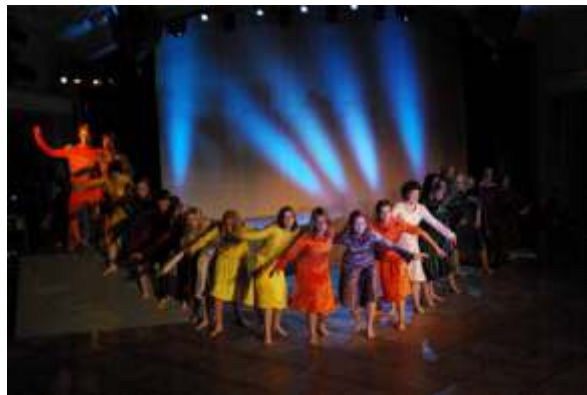
Dansere fra Bygda dansar Lea de i forestillingen "Flate steinar er til å sitja på" i Bergen, juli 2010.