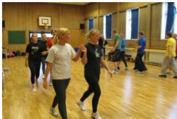
Bygda dansar Danseru' på skoleturné, januar 2010.