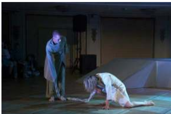
Fra "Flate steinar er til å sitja på".