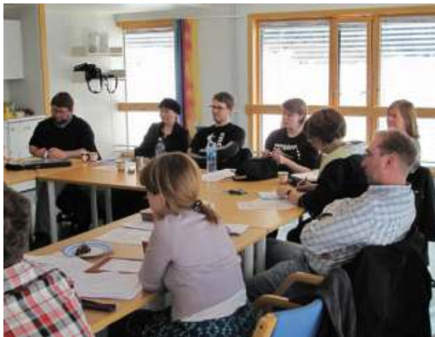
Arkivseminar på Rff-sentret, mars 2010.

Arkivseminaret 2010 ble arrangert på Rff-sentret 22.-24. mars med 22 deltakere fra 15 ulike folkemusikkarkiv og museum. Arkivseminaret ble arrangert av Nettverk for norske folkemusikkarkiv, Trondheim.