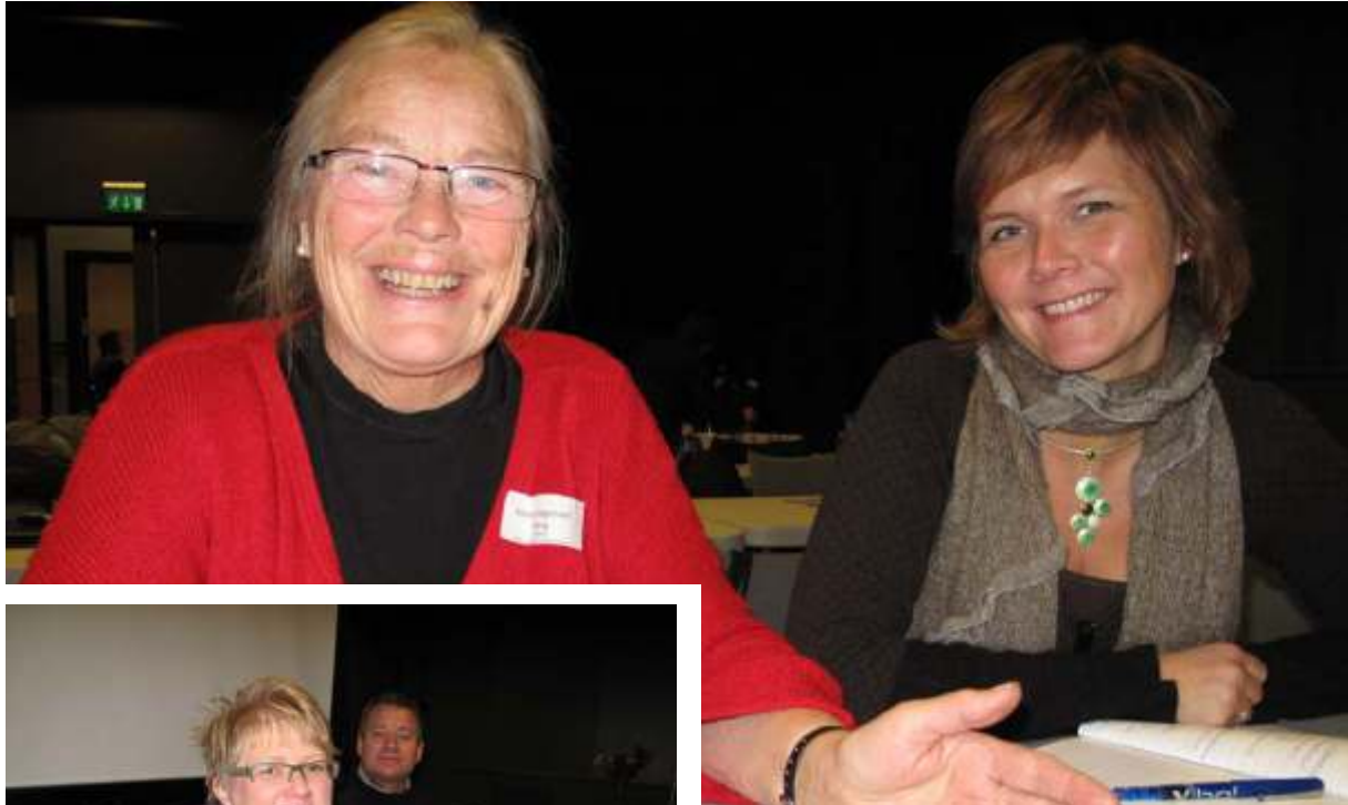
Deltakere på Representantskapsmøtet med fagdager i Oslo.