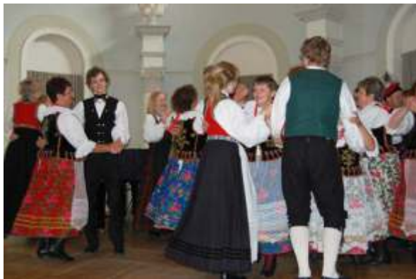
Ungdommer fra Bygda dansar svinger seg med polske dansere.