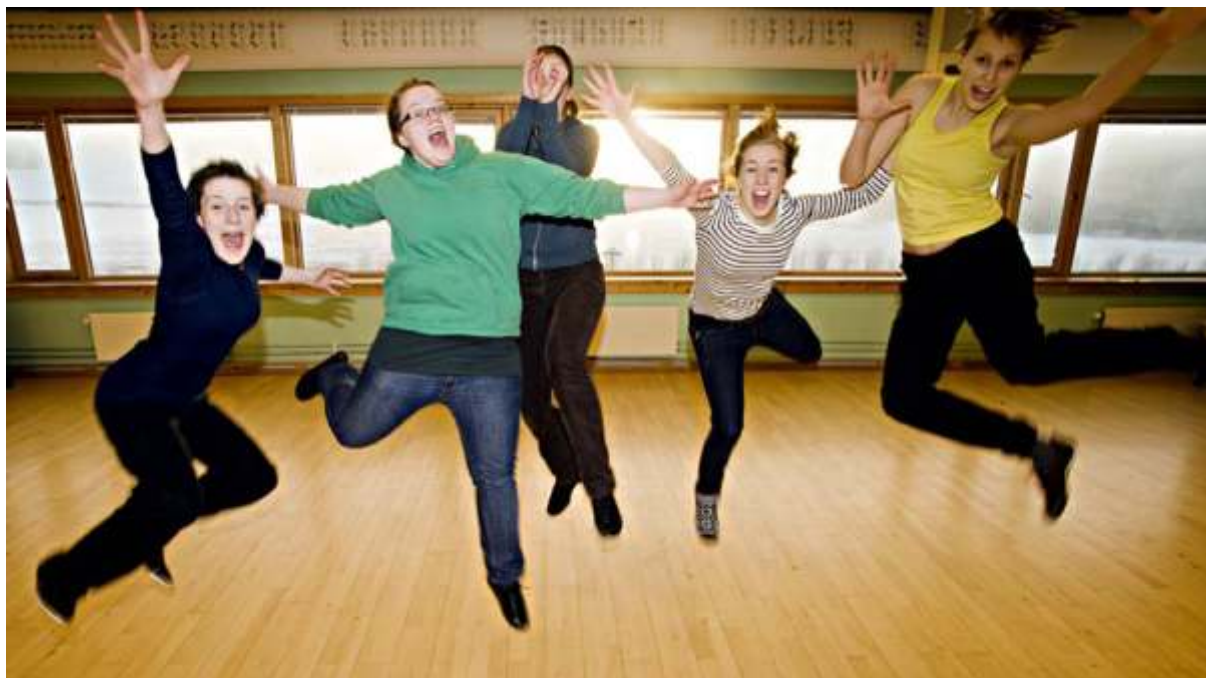
Utøverstudentene i den nye dansesalen på Rff-sentret.