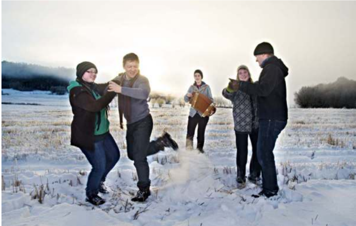
Utøverstudentene ved dansevitenskap med danserpartnere.

gruppetimer med hovedlærerne. I høstsemesteret hadde de i tillegg enetimer med læremester mellom samlingene. Studentene fulgte også emnet tradisjonskunnskap ved NTNU som en del av studiet i vårsemesteret. Studentene har hatt oppdrag på 8. mars-feiringa i Trondheim, og hatt "hus-visninger" ved NTNU. De hadde kveldskonert sammen med Utøverstudiet i Folkemusikk, OBA 24. mars, og under Osafestivalen 29. oktober.