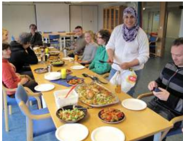
Lunsj under flytteprosess på Rff-sentret.

I løpet av 2009 flyttet Rff-sentret fra lokalene sine i hovedbygget på Dragvoll til 4. etasje på Idrettssentret et par steinkast unna. Institusjonen ble midlertidig trengt sammen på mindre arealer enn vi hadde før, og fikk etter hvert en midlertidig dansesal som var altfor liten. Våren 2010 ble Rff tildelt lokaler i samme etasje, men i en annen øy, og i løpet av 2010 har sentret nok en gang flyttet til andre lokaler. Flytting ble gjennomført delvis på våren og delvis på høsten. Foruten utgifter knyttet til flytting på ca. 200 000.- ble det brukt mye interne ressurser. På sommeren ble en ny, større og permanent dansesal klar til bruk. Vi har delvis fått plass bibliotek og rom for lyd- og bildeteknisk arbeid. Originalarkivet vårt er foreløpig lagret i kjelleren på hovedbygget.