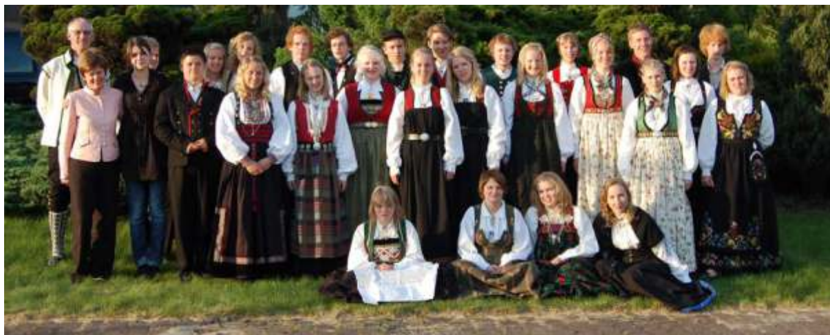
Ungdommer fra Bygda dansar på tur til Polen i juni 2010.