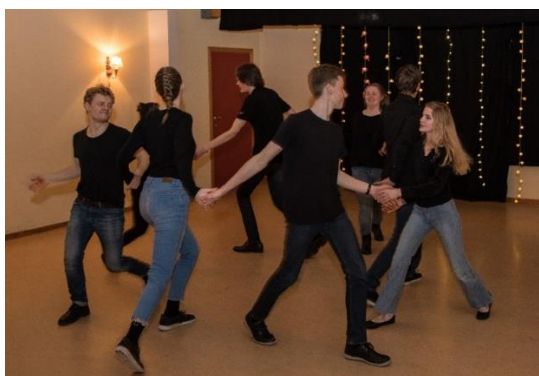
Fra midtforestilling.

Selv om det ikke har vært rom for en stor undersøkelse av ungdommenes erfaringer, uttrykker de som er blitt intervjuet om sin deltakelse at de har erfart helgesamlingene som noe positivt. Som en forklarte om samlingene: «Sirka en helg i måneden, både opp mot forestilling, og noen mer frie helgesamlinger. Jeg dansa for det meste med den gjengen som var med i Bygda dansar. Kom ikke i kontakt med andre. Alt i alt fungerte det greit» (deltaker). Vedkommende la også vekt på at det var mye fokus på forestillingene: «Der møttes vi på en skole, og var i vår egen boble. Lørdagskvelden – dansearrangement med de lokale». Også prosjektrapportene framstiller dette som en svært positiv aktivitet som ikke har bydd på andre utfordringer enn de som knyttet seg til den rent praktiske gjennomføringen og behovet for tilgang på frivillig arbeidskraft.