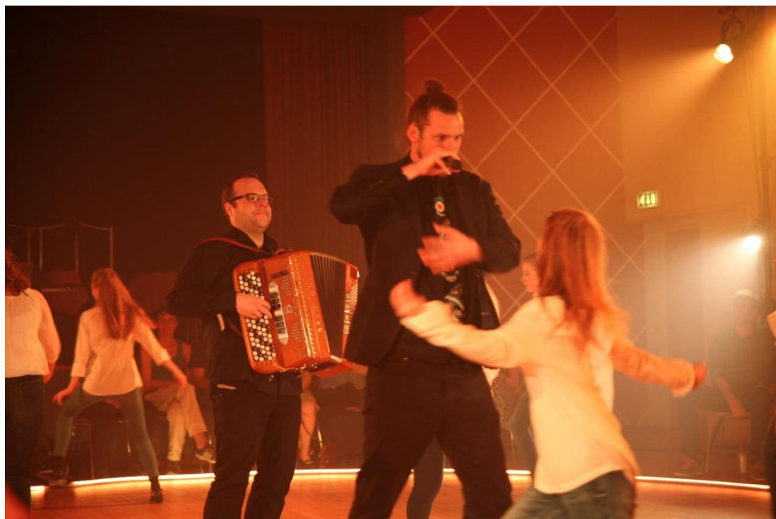
Fra Bygda dansar-forestilling.

mot. Ga veldig mening at vi skal øve inn noe» (deltaker). En deltaker som hadde vært med i flere prosjekt, trakk også fram at det var mest inspirerende da ungdommene selv fikk en innflytelse på det som skulle presenteres på scenen. Også de lokale søkerne trekker fram forestillingene som en side ved Bygda dansars arbeid som har vært opplevd som et svært positivt innslag. Forestillingene har jevnt over også fått god pressedeckning og positiv oppmerksomhet i mediene, og de er både blitt vist på nasjonale og regionale scener slik som: Riksscenen, Telemarksfestivalen og Regional arena for samtidsdans.